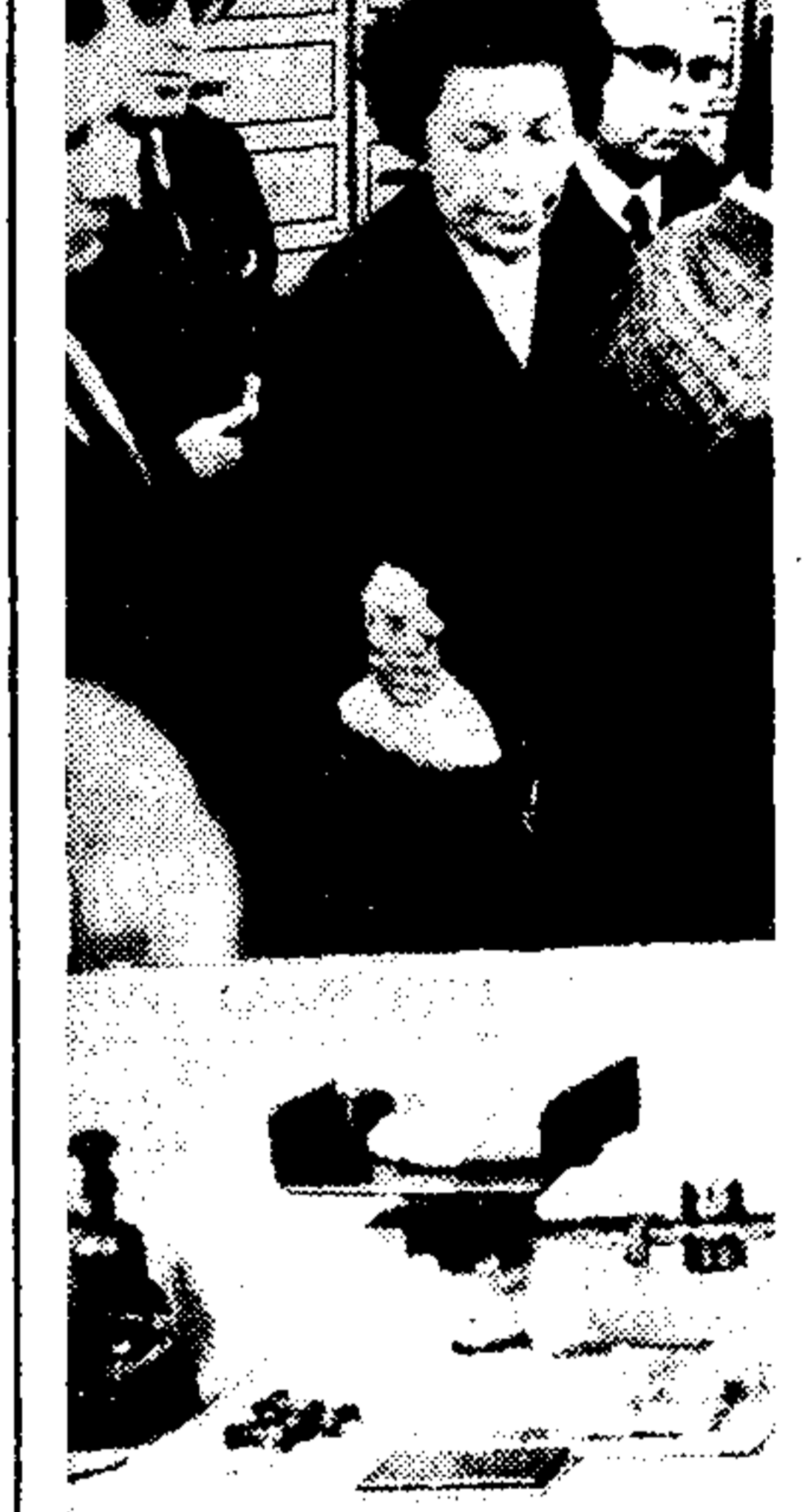
Στις θυρίδες της Εθνικής Τραπέζης. Η κατανομή των γραμμάτων...